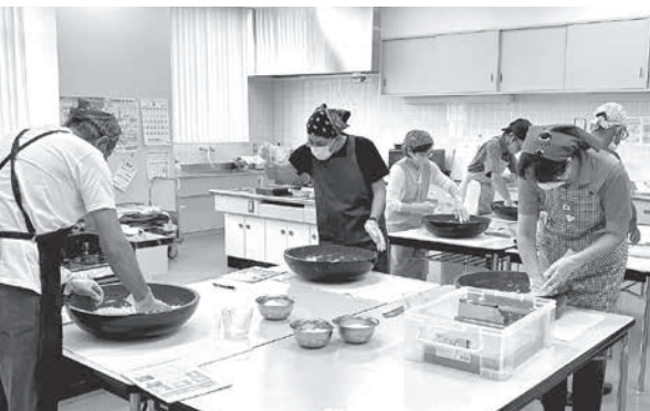
「そば打ち体験講座」の様子