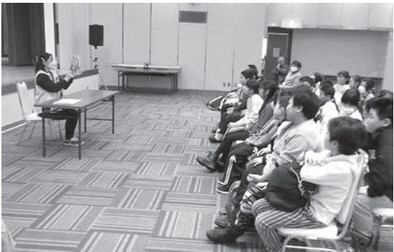
おはなしの会かもめによる読み聞かせ