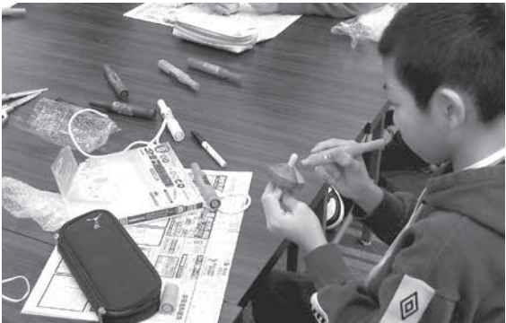
コマと絵馬を作りました

12月26日(金)、峰栄館で開催したチビッコ公民館に町内の小学4年生26名が参加しました。コマと絵馬づくり、秋田弁かるた遊び、紙芝居の読み聞かせを楽しんだほか、10年後の自分への手紙を書きました。この手紙はタイムカプセルとして保管され、八峰町20歳を祝う会で本人に手渡される予定です。また、防災学習として、ポリ袋を利用して電気を使わずにできる炊飯を体験しました。炊きあがったご飯はカレーライスにして美味しくいただきました。地域の大人や児童同士で交流を深めながら、様々な体験をして、充実した一日を過ごしました。