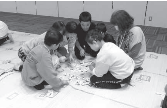
秋田弁かるたを楽しみました

8月から12月にかけて開講した生涯学習講座「そば打ち体験講座」の受講者有志により、この度、『二八(にはち)そば友の会』が結成されました。今後は自主学習グループとして、そば打ちの技術向上と試食を通じた交流を継続的に行っていく予定です。現在は男女7名のメンバーですが、見学希望や興味がある方は峰栄館にお問い合わせください。