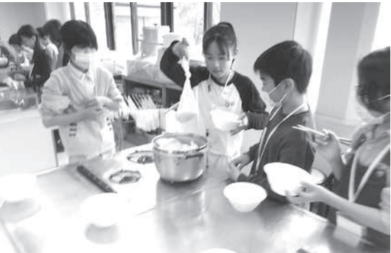
耐熱ポリ袋を使った体験